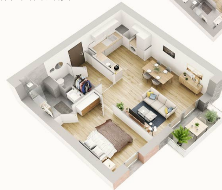
APPARTEMENT T2 B0-6 - REZ DE CHAUSÉE Surface habitable : 48,68m 2 Surface extérieure : 4,00m 2