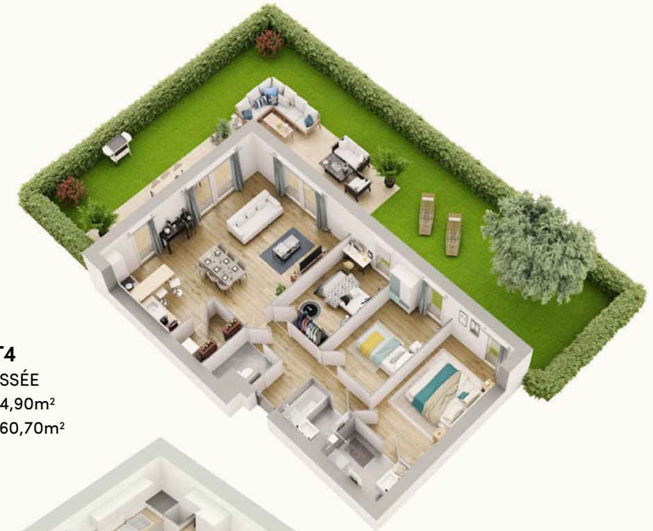
APPARTEMENT T4 B0-6 - REZ DE CHAUSÉE Surface habitable : 94,90m 2 Surface extérieure : 160,70m 2

VASQUE SANIJURA OU ÉQUIVALENT 80 x 46cm Coloris au choix